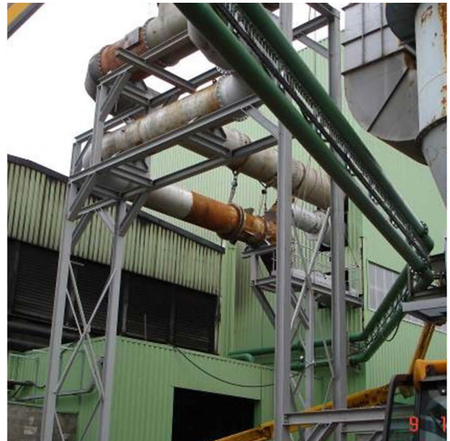
Montage tuyauterie et racks